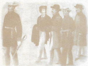
DESEMBARQUE DE BOLÍVAR EN OCUMARE

REPÚBLICA BOLIVARIANA DE VENEZUELA REPUBLICA BOLIVARIANA DE VENEZUELA REPUBLICAN BOLIVARIAN VENEZUELA