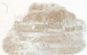
ASALTO DE PUERTO CABELLO