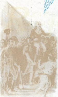
DESEMBARQUE DE MIRANDA EN LA GUAIRA EN 1810