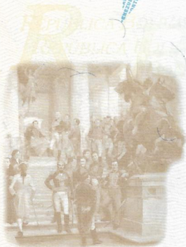
EL PANTEÓN DE LOS HÉROES