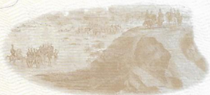
BOLÍVAR EN EL CERRO BUENAVISTA