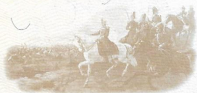
BATALLA DE JUNÍN