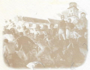
SITIO EN VALENCIA