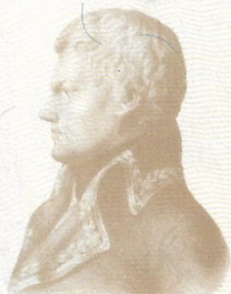
FRANCISCO DE MIRANDA