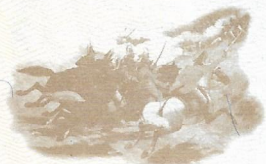
BATALLA DE CARABOBO