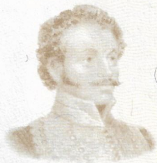
JOSÉ ANTONIO PÁEZ

EL DEL INTE RTEOL JELAPB AREPUBL FRENDELAPADARTEP LICADOLVARIAMASEVE "ANADIVITELALAPAPOTTESELA" "PBLICADOLVARIAMADIVITELAP" "LAPALAPOTTESELANEPUBL" "ANADIVITELAPAP" ASIANADIVITELAPAP JAPOTTESELANEPUBL EZULAPAPAPOTTESELA" ELABEY "OLIVARI VARIAN" LAREP "AP "P