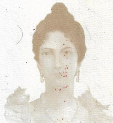
LUISA CÁCERES DE ARISMENDI

REPUBLICA ARGENTINA MINISTERIO DE EXTERIOR PASAJES INTERNACIONALES BUENOS AIRES 08 JUN 2015 ARGENTINA REPUBLICA ARGENTINA MINISTERIO DE EXTERIOR PASAJES INTERNACIONALES BUENOS AIRES 08 JUN 2015 ARGENTINA