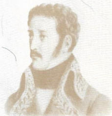
JOSÉ FÉLIX RIBAS